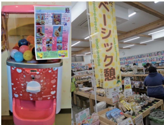
『ガチャポンとのぼり旗』